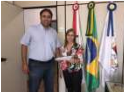
(E) Prefeito Vinícius Barreto recebe da Secretária de Educação Nádja Cássia a informação de que Perdizes é 1º lugar na educação na região.

dedicação e cuidado com nossa educação e com nossos estudantes, deixo aqui meu apoio e meus cumprimentos a todos vocês que trabalham juntos a Administração para darmos à Perdizes um ensino de qualidade." Disse o Prefeito Vinícius Barreto. O site para pesquisa destes resultados é http://www.simave.caedufjf.net/ e a sequência das opções "SIMAVE"? "Avaliação Externa"? "PROALFA 2017" "Resultados" "Escola", que é de domínio público, podendo ser consultado por qual-