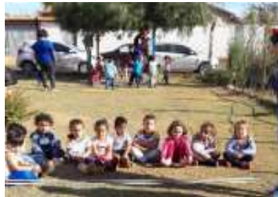
CMEI Maria Franco