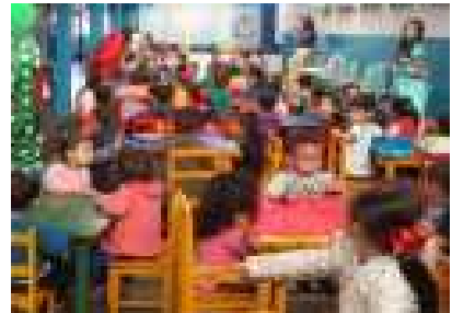
CMEI Lar da Criança Feliz.