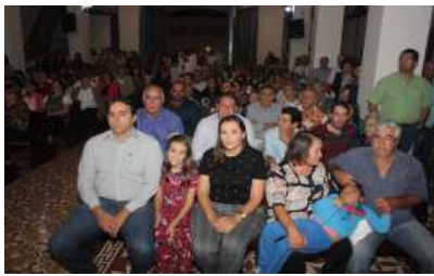
O local passou por um processo de restauração completo e as principais mudanças foram remoção e substituição completa do forro e da fiação elétrica. Os altares foram restaurados, e toda a estrutura recebeu tratamento anti-cupim. A pintura acima do presbitério foi restaurada e também o piso do corpo da Igreja. Foram colocados pontos de luz e um belíssimo lustre. A pintura de todo prédio, inclusive do telhado foi refeita. E ainda a consolidação estrutural do mezanino.