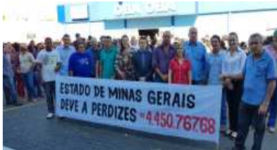
Autoridades locais como Secretários e Vereadores se uniram aos servidores e a população para manifestar contra o não repasse de verbas do Estado para município.