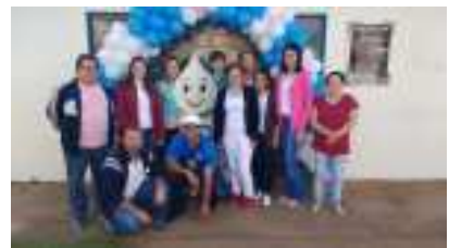
Foram aplicadas 540 doses das vacinas contra a pólio e sarampo. A meta do Ministério da Saúde é vacinar pelo menos 95% das crianças em todo o país independente da situação vacinal delas e criar uma barreira sanitária de proteção da população brasileira.