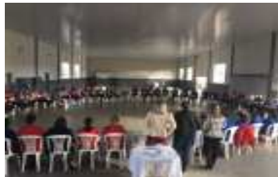
Curso de musicalização