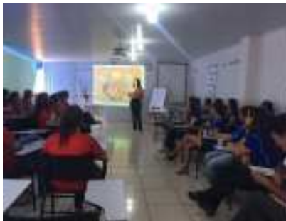
Curso para a equipe de apoio dos CMEIs

festividades. É uma afirmação da importância e significado dessa etapa da Educação Básica na vida e na formação das crianças desse país. Considerando o histórico da Educação Infantil, o estabelecimento dessa agenda anual é uma ação política altamente significativa para o fortalecimento das políticas públicas e para o reconhecimento social dos sujeitos da primeira infância”.