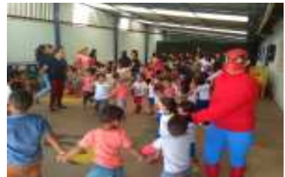
CMEI Geralda Rita