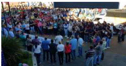
Os servidores foram solícitos ao chamamento e juntos com a população protestaram diante da crise financeira em que o Estado deixou os municípios mineiros.